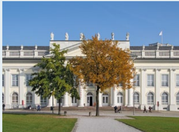
Joseph Beuys: „7000 Eichen“, die beiden Eichen vor dem Fridericianum in Kassel, gepflanzt 1982 und 1987, © Stiftung 7000 Eichen, Foto Annli Lattrich 2015

Als der Bildhauer und Aktionskünstler Joseph Beuys im Jahr 1982 in Kassel zur documenta 7 den ersten von 7000 Bäumen pflanzte, war das der Beginn der Umsetzung eines utopisch anmutenden Gesamtkunstwerks von bisher ungekannter Dimension. Entgegen allen Widerständen gegen „7000 Eichen – Stadtverwaltung statt Stadtverwaltung“ und mit Hilfe zahlreicher Stiftungen, Spenden und Einzelpatenschaften konnte 1987 zur documenta 8 die letzte Eiche gesetzt werden.