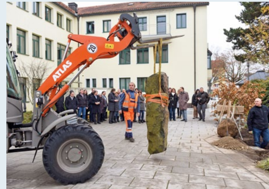
Eichenpflanzung im Rathausinnenhof am 24.11.2016