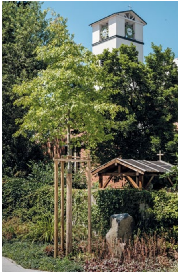
Eiche im Rathausinnenhof gepflanzt am 24.11.2016, Stand Juli 2017